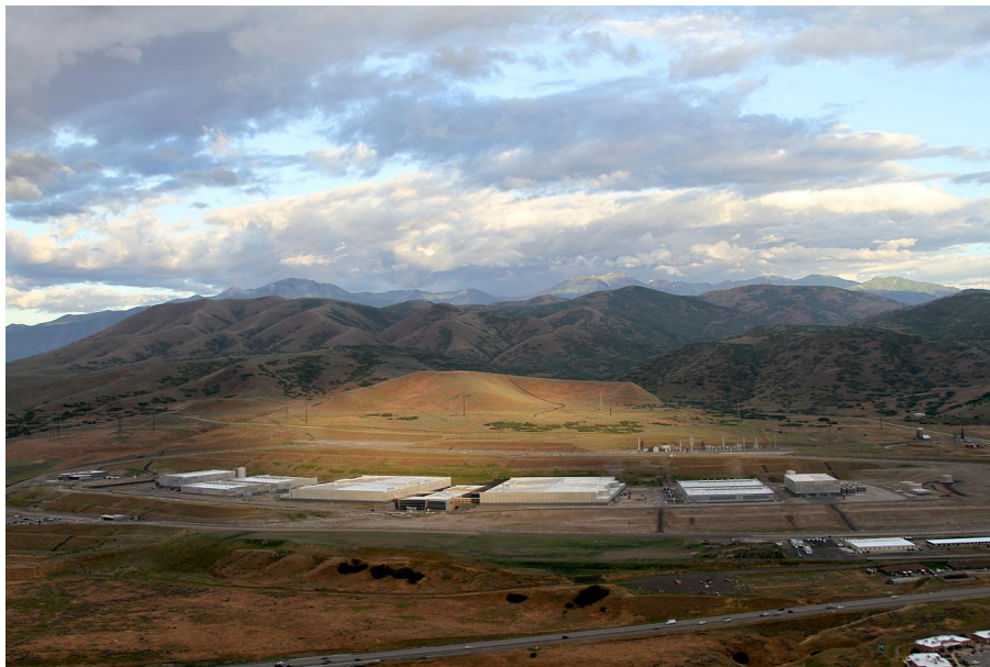
Figura 2. Data center da NSA.

de uma “contrainsurgência preventiva” levantada por Arantes resolve uma parte deste problema, mas não exatamente com os termos que ele colocou. Antes das Primaveras, é bom lembrar daquilo que Stephen Graham apontou em “Cidades Sitiadas” (2016): o alvo de Bin Laden era a “urbe”, objeto primário de ódio de sua rede; o ataque foi no coração do sistema financeiro. A reação dos EUA foi não somente produzir um estado de sítio generalizado no Globo, mas também deslocar o “coração da América”, suas forças militares, no plano doméstico, para o interior, o “heartland” em sua essência, “caipira”, branco, macho, evangélico, armado e logo logo desempregado (Lutz, 2002). Isto não é pouco. Não podemos esquecer que além das sedes de Forças Especiais geralmente se interiorizarem (no Brasil estão predominantemente em Goiás, na Amazônia e na periferia do Rio de Janeiro), os capitais se movem entre ilhas e em lugares desconhecidos, os “Paraísos Fiscais”; os data centers nunca coincidem com as “Férias Limas”, que são a ponta da linha – sendo que o maior deles no mundo, o da NSA (National Security Agency, o hub de “tudo”), está encravado entre as Rochosas em Utah.