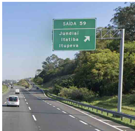
Figura 2: Saída 59, Rodovia dos Bandeirantes.