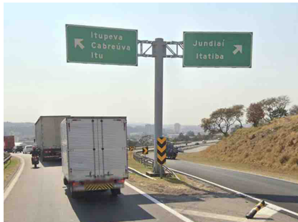
Figura 3: Bifurcação, Saída 59, Rodovia dos Bandeirantes.