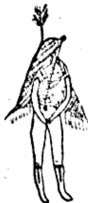
Figura 03: “Wou ghost” Fonte: Donahue 1982: 284.

A festa é chamada genericamente de ix̃ju uni , mas pode ser nomeada de acordo com os inimigos específicos que a povoam, de modo que os Karajá podem se referir a wou uni ♂ (“espírito de Tapirapé”), àralahu uni ♂ (“espírito de Kayapó”), tori uni ♂ (“espírito de branco”) 32 e assim por diante. André Toral (1992: 194) apresenta, em sua dissertação, uma fala de Paulo Ijawari (aldeia São Domingos) que marca essa multiplicidade de inimigos, bem como introduz um detalhe importante sobre a relação entre “dançarinos” e espíritos: